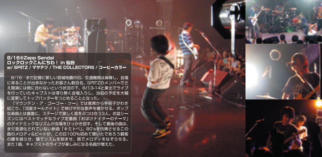
8/16@Zepp Sendai ロックロックこんにちは! in 仙台 w/ SPITZ / マサテツ / THE COLLECTORS / コーヒーカラ

8/16…まだ記憶に新しい宮城地震の日。交通機関は麻痺し、会場に来ることが出来なかったお客さん数万名。SPITZのメンバーでさえ開演には間に合わないという状況の下、8/13-14と東北でライブを行っていたキャプストは滞り無く会場入りし、当初の予定を大幅に変更してトップバッターをつとめることとなった。 「マウンテン・ア・ゴーゴー・ツアー」では客席から手拍子がわき起こり、「流星オーナナイト」で伸びやかな歌声を響かせる。ポップな楽曲とは裏腹に、ステージで激しく音をぶつけ合う3人。お盆シーズンはベストマッチなライブ定番曲「おぼけナイターのテーマ」のダイナミックなリズムが会場をひっきりかき回す。そして最後の曲は、まだ音源化されていない新曲「キミトベ」。80'sを彷彿させるこの曲のメロディ&ビートが、この日100%初めて聴いたであろう観客の腹を揺らせ、踵でリズムを刻ませ、肩でメロディをなぞらせる。また1曲、キャプストのライブが楽しくなる名曲が増えた。