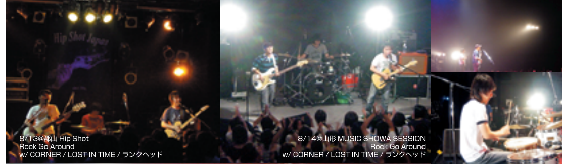
8/13@郡山 Hip Shot Rock Go Around w/ CORNER / LOST IN TIME / ランクヘッド