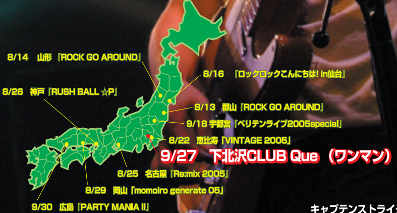
キャプテンストライダム2005年夏のLIVE総決算